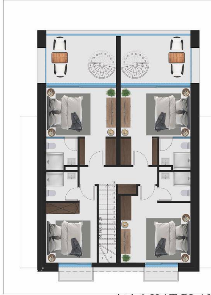
4+1 1.KAT PLANI