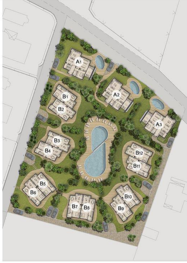
Vaziyet Planı (Zemin Kat Planı)