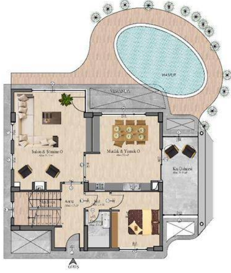
Zemin Kat Planı Alan:109.5 m 2