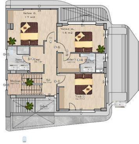
1. Kat Planı Alan:97 m 2