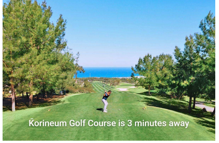
Korineum Golf Course is 3 minutes away