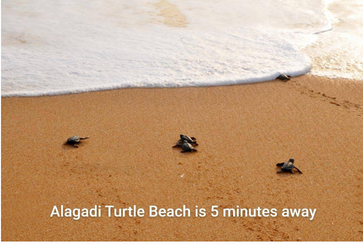
Alagadi Turtle Beach is 5 minutes away